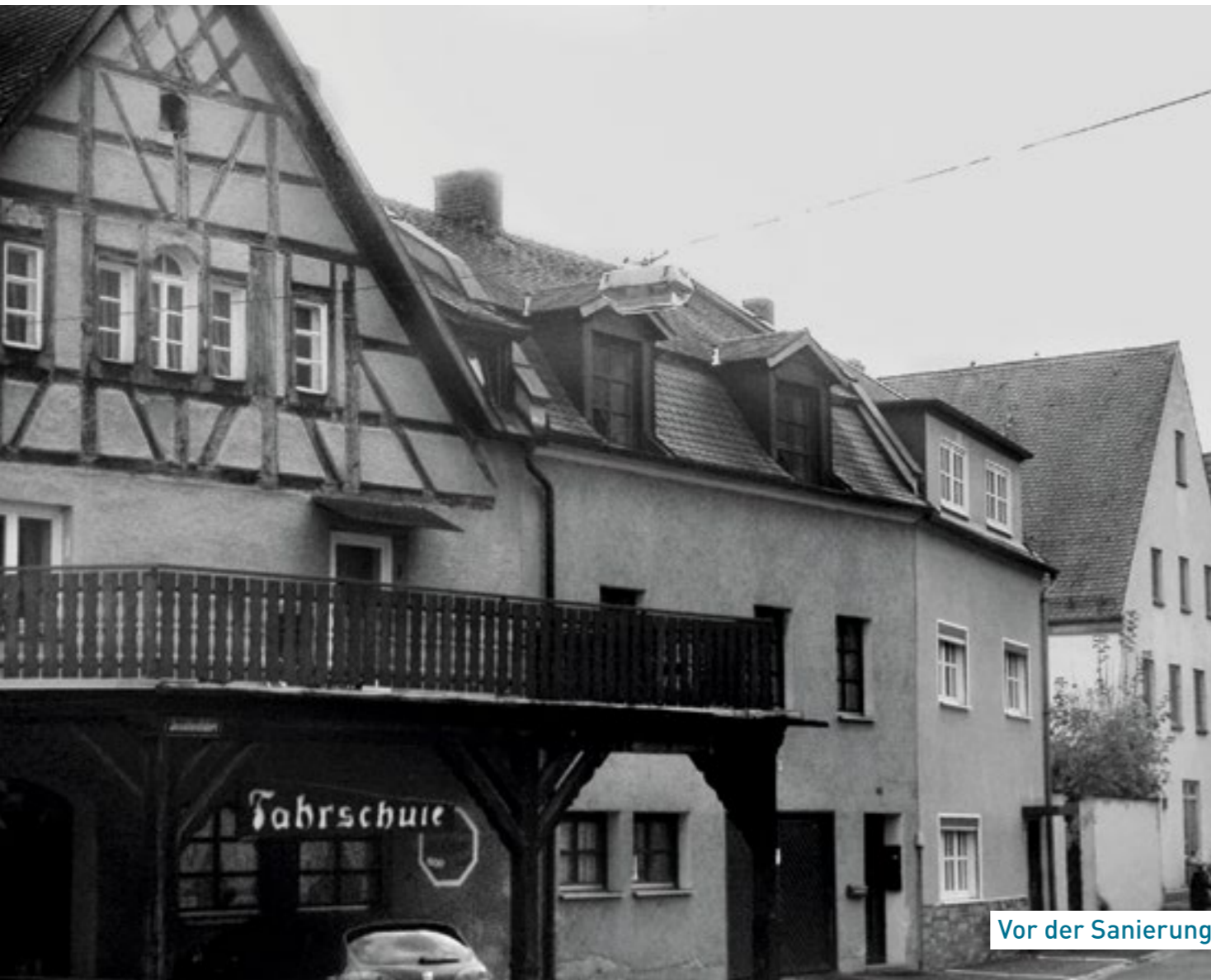
Vor der Sanierung