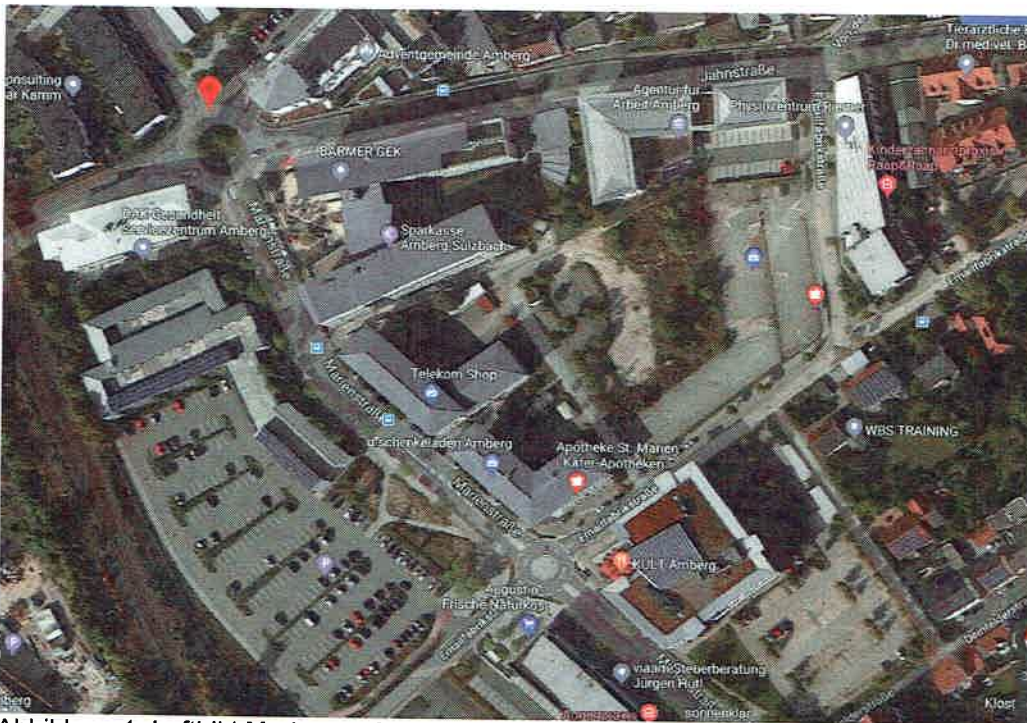
Abbildung 1: Luftbild Marienstraße Amberg

Dies heißt für den Sachverhalt, dass von den 4.148 Notfallereignissen nur ein Teil mit Sonderrechten in das Klinikum transportiert wird. Erfahrungsgemäß ist hier von ca. 50% der Einsätze mit Nutzung der Sonderrechte anzusetzen.