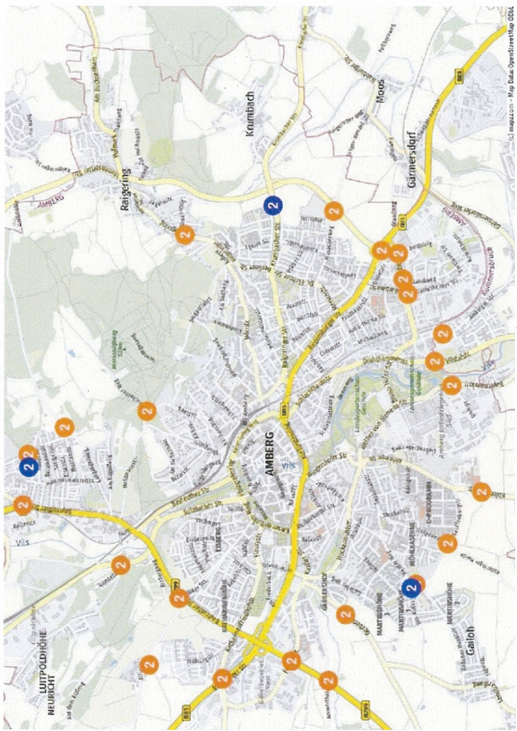
Anlage 3 - Schematische Darstellung des Änderungsantrages - Gesamtansicht